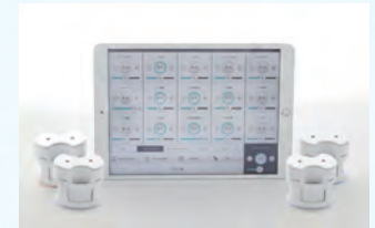
イーマ・サウンドセラピーに使用する最先端システム「OTOtron(オトロン)」

ポワーンという音と、光を放つOTOtronが、あなたの心と身体をやさしく包みます。